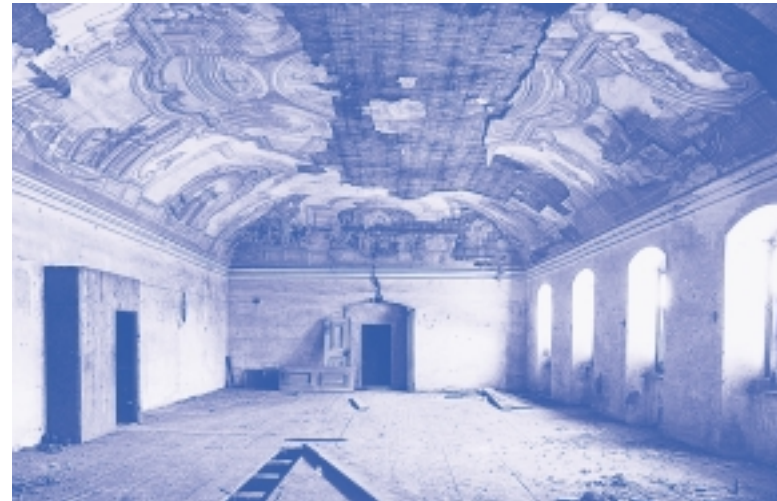
Die Sanierung von Denkmälern ist in Deutschland ein nicht zu unterschätzender Wirtschaftsfaktor.