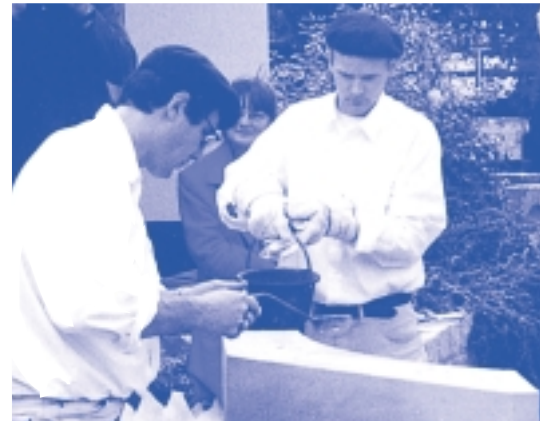
Meißeln für die Zukunft: Junge Steinmetze bei der Arbeit in der Denkmalpflege

unterschiedlich geregelt. Kein einzelnes System ist auf alle anderen Länder übertragbar. Es gibt den Bedarf, Sinnvolles zu verknüpfen und neue Möglichkeiten zu nutzen. Auch das bedeutet im zusammenwachsenden Europa eine Erweiterung, die im Kultur schaffenden Steinmetzhandwerk exemplarisch ein generationsübergreifender Prozess ist. Dieser ist eine Chance, wenn er kreativ und positiv genutzt wird. Voraussetzung dafür ist eine vorbehaltlose Akzeptanz der Kollegen europaweit, ihrer Tätigkeiten und ihrer gesellschaftlichen und kulturellen Bedeutung in den jeweiligen Ländern mit jeweils unterschiedlichen Rechtsordnungen. Ebenso verbindet das gemeinsame Streben nach immer anspruchsvolleren Qualitätsstandards bei der Vermittlung von Fertigkeiten und Kenntnissen und deren Graduierung.