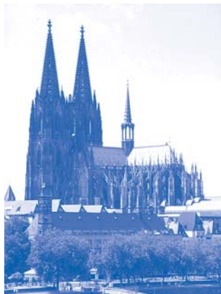
Der Kölner Dom steht auf der »Roten Liste« der UNESCO.

1972 hat die UNESCO das »Internationale Übereinkommen zum Schutz des Kultur- und Naturerbes der Welt« (Welterbekonvention) verabschiedet. Die Liste des Welterbes umfasst 788 Stätten in 134 Ländern. In Deutschland sind rund 30 Kultur- und Naturstätten als UNESCO-Welterbe verzeichnet. In der »Roten Liste« werden Denkmäler eingetragen, deren Zustand und Erhaltung durch menschliche Eingriffe, Naturkatastrophen oder durch neue Planungen und Veränderungen des Umfelds bedroht ist. Mit dieser Liste weckt die UNESCO das öffentliche Interesse und die Aufmerksamkeit der politisch Verantwortlichen, um den betroffenen Staat zum Handeln und die Staatengemeinschaft zur Unterstützung zu bewegen. Weltweit stehen rund 33 Welterbestätten auf der Roten Liste.