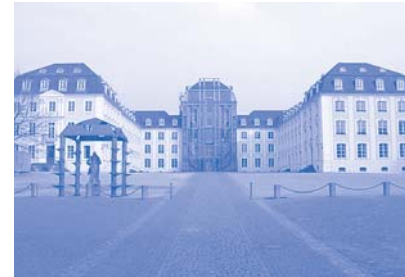
Stahl-Glas-Mittelbau des Saarbrücker Schlosses von Gottfried Böhm (1981/89)

Sich um die Ausschreibung eines Architekten-wettbewerbes zu bemühen, ist allemal besser, als mit tümmelnden Vorgaben Schadensbegrenzung betreiben zu wollen. Zweifellos muss die neue Architektur Respekt vor dem Alten haben, muss sie dieser ihre Würde lassen. Wer den zu Recht vielbeschworenen genius loci nicht spürt, wird kaum Architektur für die Zukunft machen können. Viele gute Beispiele aus der jüngeren Vergangenheit bestätigen diesen Ansatz. Man denke etwa an den Stahl-Glas-Mittelbau des barocken Saarbrücker Schlosses von Gottfried Böhm (1981/89), an das gläserne Modehaus am Milchmarkt in Schwäbisch Hall von den Stuttgarter Architekten Maler, Gump und Schuster (1993) oder aber an Egon Eiermanns