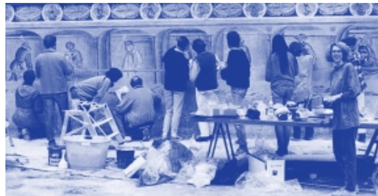
Studenten der FH Hildesheim/Holzminden/Göttingen während der Restaurierung der Hochschulfassade

wird ein breites Spektrum konservatorischer, kunsttechnologischer sowie natur- und geisteswissenschaftlicher Inhalte vermittelt.