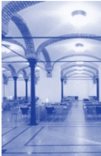
MDR-Casino im ehemaligen Schlachthof in Leipzig.