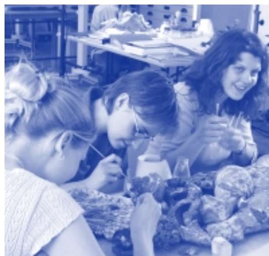
Werkstatt der Fachhochschule Erfurt

Der Studiengang in München gibt keine Trennung in einzelne Materialbereiche vor: Es erfolgt zunächst keine Spezialisierung, vielmehr