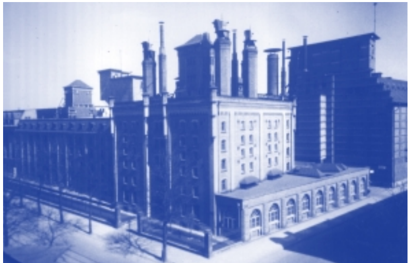
Die ehemalige Malzfabrik in Erfurt – erbaut um 1880

Daneben gibt es aber auch Erfreuliches zu berichten: Im Rahmen der zweiten Leipziger Messeakademie suchen 230 Studenten aus ganz Deutschland nach Konzepten zur Neunutzung von 14 Industriedenkmalen aus der Dreiländerregion. Die besten zehn Arbeiten werden am 2. November 2002 während eines Fachkolloquiums in Leipzig vorgestellt.