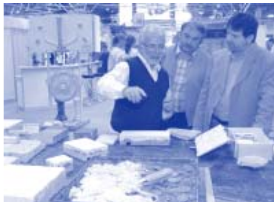
Einblicke in die handwerkliche Denkmalpflege: hier die Nachstellung von Ziegelsplitt-Fußböden

Das internationale Kongressprogramm der denkmal 2002 umfasste rund 60 hochkarätig besetzte Tagungen, Symposien, Diskussionsrunden und Fachvorträge. Für etwa die Hälfte der Besucher war das Rahmenprogramm mit ausschlaggebend für den Messebesuch. Einer regen Nachfrage erfreute sich der Katalog der diesjährigen denkmal-Börse. Dieser umfasst 326 geschützte Gebäude in Deutschland, Frankreich und der Slowakei und kann beim Leipziger Messeverlag (Fon +49 (0)3 41/6787743 · Fax +49 (0)3 41/6787712) für 25 Euro bezogen werden.