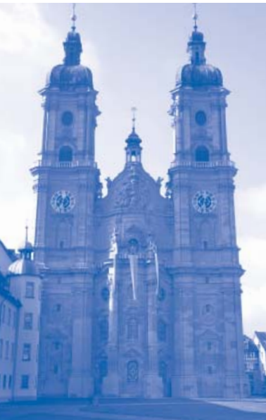
1983 in die Liste der UNESCO-Weltkulturerbestätten aufgenommen: Die St. Galler Kathedrale mit dem Stiftsbezirk