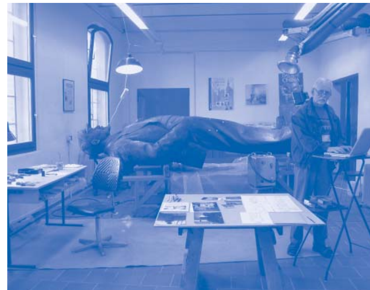
Die Leninstatue im Restaurierungsatelier