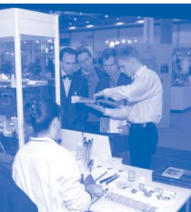
Auf der denkmal 2004 werden etwa 400 Aussteller erwartet.