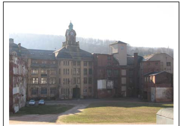
Hauptbau Marie-Müller-Straße, Hofseite