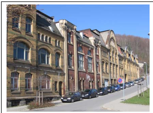
Gebäude entlang der Industriestraße

Die Wohn- und Geschäftshäuser an der Wettinerstraße und der Auerhammerstraße (Flurstück 747–759) sind nicht Teil des Planungsgegenstandes. Optional kann das Gelände 716/4 – ein Erholungsraum mit Zugang zur Zwickauer Mulde, auf dem bereits ein Fußweg angelegt wurde – mit beplant werden.