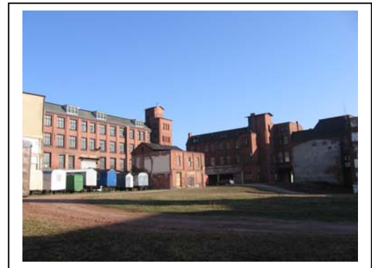
Innenhof, Blickrichtung Nord